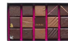
Boîte de 140 g : 16,80 € (15 chocolats)