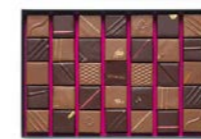
Boîte de 330 g : 39,60 € (35 chocolats)