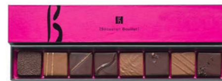
Réglette de 8 chocolats : 9,60 €

Découvrez notre gamme de bonbons chocolat croquants, fondants ou fruités... ganache au poivre de Madagascar, pure origine ou parfumée, praliné maison à l'amande ou à la noisette, rien n'est laissé au hasard. Le sucré, les parfums & les textures sont au coeur de notre réflexion pour provoquer, dans une explosion harmonieuse de saveurs, une expérience gustative unique.