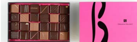
Boîte de 220 g : 26,40 € (24 chocolats)