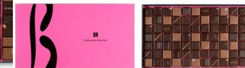
Boîte de 790 g : 94,80 € (84 chocolats)