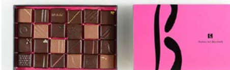
Boîte de 220 g : 26,40 € (24 chocolats)