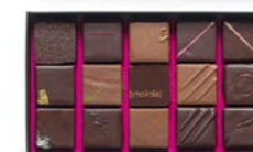
Boîte de 140 g : 16,80 € (15 chocolats)