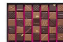
Boîte de 330 g : 39,60 € (35 chocolats)