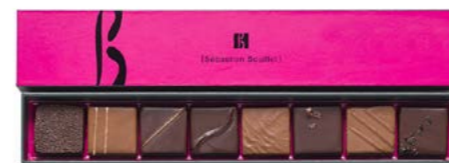
Réglette de 8 chocolats : 9,60 €

Découvrez notre gamme de bonbons chocolat croquants, fondants ou fruités... ganache au poivre de Madagascar, pure origine ou parfumée, praliné maison à l'amande ou à la noisette, rien n'est laissé au hasard. Le sucré, les parfums & les textures sont au coeur de notre réflexion pour provoquer, dans une explosion harmonieuse de saveurs, une expérience gustative unique.