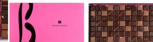
Boîte de 790 g : 94,80 € (84 chocolats)